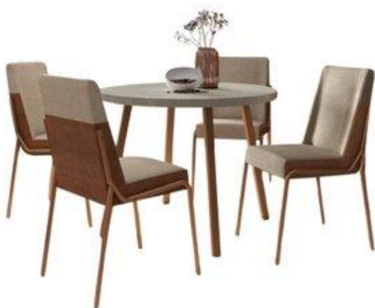
IMAGEM COM TEOR MERAMENTE ILUSTRATIVO