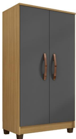
IMAGEM COM TEOR MERAMENTE ILUSTRATIVO

CONJUNTO SALA JANTAR 4 CADEIRAS ESTILO MODERNO, FORMA DA MESA REDONDA, MATERIAIS DA MESA MADEIRA, METAL, MATERIAIS DAS CADEIRAS MADEIRA, METAL, ALTURA DA MESA 78 CM, LARGURA DA MESA 100 CM, ALTURA DAS CADEIRAS 88 CM, LARGURA DAS CADEIRAS 46 CM, PROFUNDIDADE DAS CADEIRAS 60 CM